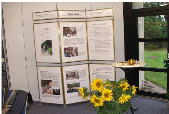
5 Jahre Diakonieverband – Eröffnungsveranstaltung zur Woche der Diakonie / Paulus-Gemeindezentrum Burgdorf

Die Eröffnungsveranstaltung zur Woche der Diakonie im Paulus-Gemeindezentrum Burgdorf bot dem Hospizdienst Gelegenheit, sich einem umfassenden, nicht nur kirchlich orientierten Publikum mit seiner Arbeit und seinen ehrenamtlich Tätigen vorzustellen.