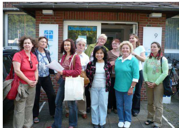
Gruppenbild ehrenamtlicher Mitarbeiterinnen des Hospizdienstes

Insgesamt gesehen geht für das Jahr 2007 aus der Befragung ein hohes Maß an Zufriedenheit der ehrenamtlichen Mitarbeiterinnen und Mitarbeiter in ihrer Tätigkeit im ambulanten Hospizdienst hervor.