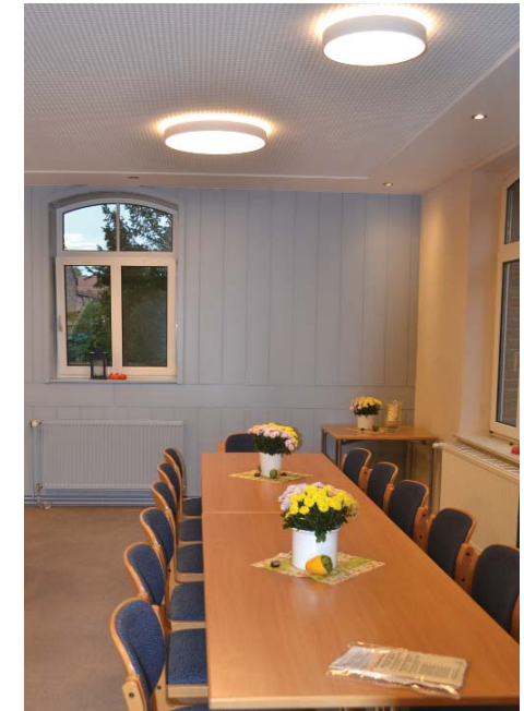
Gemeinderäume in neuem Glanz

Gemeindebrief der Ev.-luth. Kirchengemeinde Zum Heiligen Kreuz – Oktober/November 2021